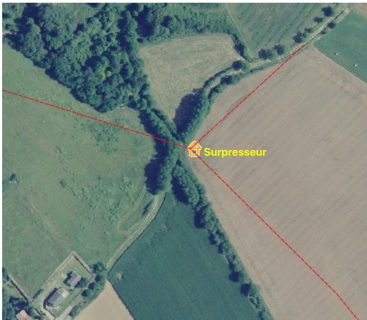
Localisation du surpresseur, à l'angle d'une grande parcelle de culture, côte de Toisieu, commune de Saint-Prim.