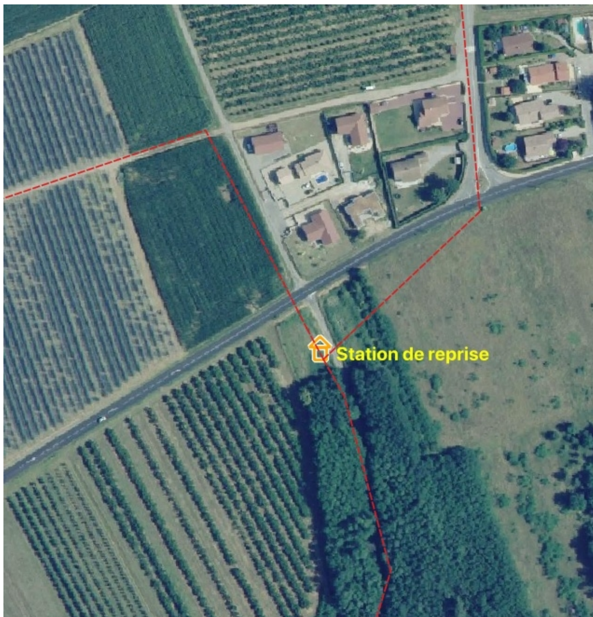
Implantation de la station de reprise sur une petite parcelle en bordure de vergers, secteur de « Sur Glay », commune de St-Prim.