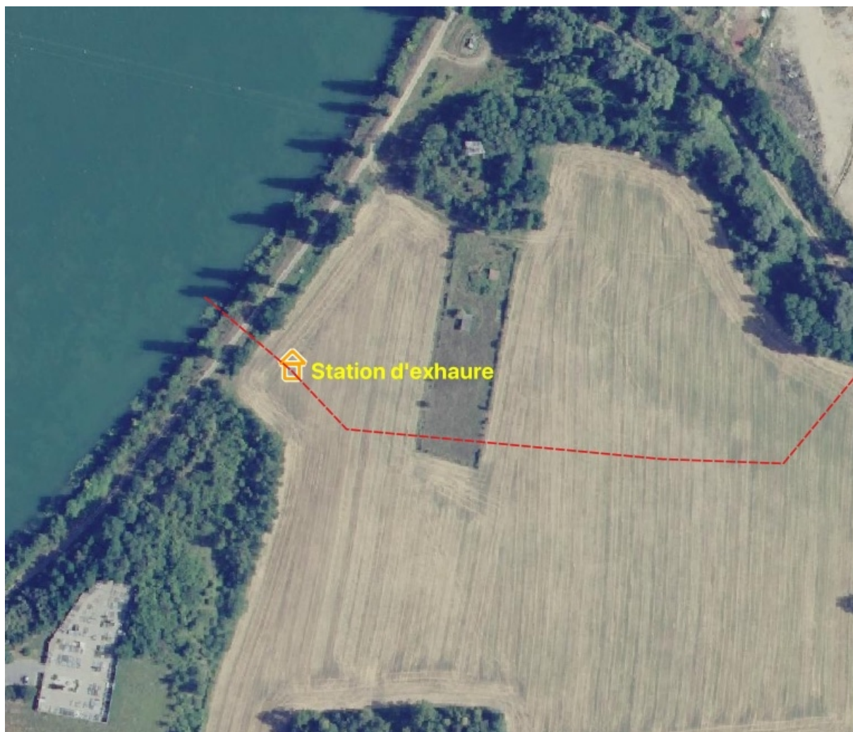
Localisation de la station de pompage principale (exhaure), en arrière de la digue du Rhône (parcelle de grande culture), au pied de la butte du cimetière de St-Alban-du-Rhône.